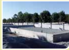
Nouvelle station d'épuration