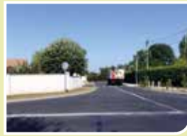
Travaux de sécurité, acte II