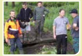
De futurs bûcherons chez nous !