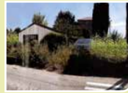
Bientôt de nouveaux professionnels de santé