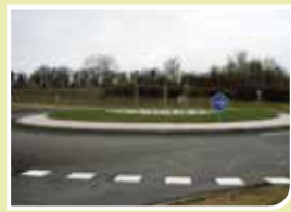
Le point sur les chantiers