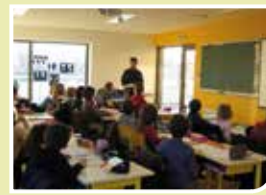
Écoles: le point sur les changements à venir