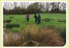
Inventaire des zones humides: bilan