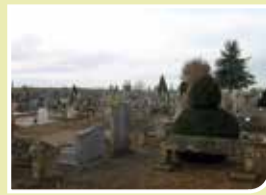
Le cimetière va faire peau neuve